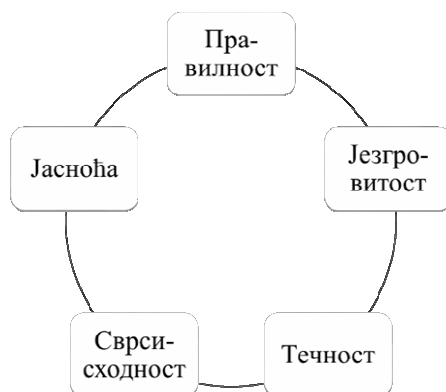
Графички приказ 2. Основне карактеристике доброга говора 20

Усмена презентација рада мора да буде огледало култивисаног говора. „Данас се као добар говор може оценити онај који има следеће карактеристике: јасноћу, језгровитост, сврсисходност, правилност и течност (флуентност)” (Ђорђевић, 2018: 35), в. Графички приказ 2.